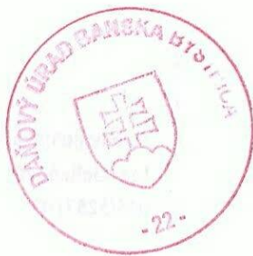
Ing. Viera Fekiačová vedúci oddelenia správy daní 13

Správny poplatok vo výške 3,- eur bol uhradený v zmysle zákona č. 145/1995 Z. z. o správnych poplatkoch v znení neskorších predpisov podľa položky 143b/ Sadzobníka správnych poplatkov. Potvrdenie je vystavené v dvoch vyhotoveniach.