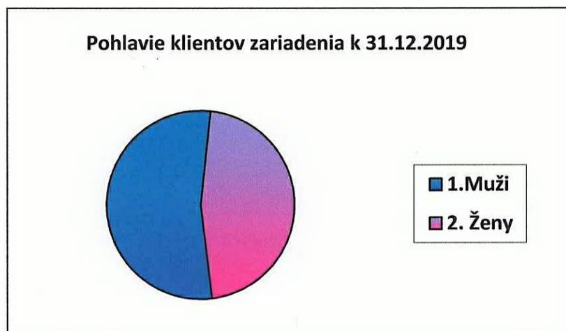
Graf č. 1: